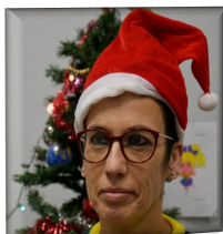
Classe de PS/MS