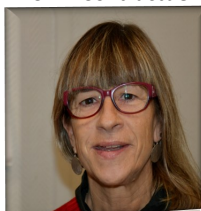
Classe de MS/GS